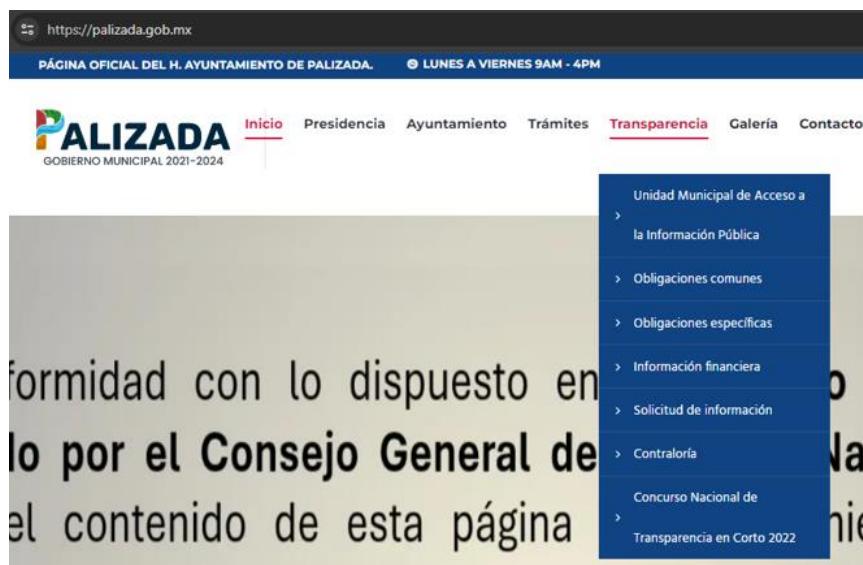
Figura 1. Captura de pantalla de los enlaces al sistema de solicitudes de acceso a la información.

La Unidad de Transparencia del municipio se encarga de coordinar el cumplimiento de la presentación de la información trimestral en la Plataforma Nacional de Transparencia y de atender las solicitudes de acceso a la información que recibe el municipio.